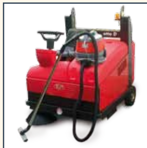
VACUUM CLEANER STAUBSAUGER STOFZUIGER