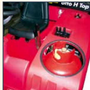
LPG SYSTEM LPG-ANLAGE GPL