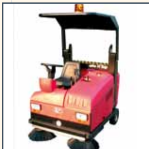
CANOPY FAHRERSCHUTZDACH OVERDEKT