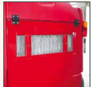
SACK FILTER SACKFILTER FILTERZAK