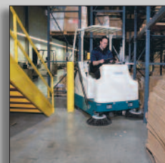
Maschine in Aktion