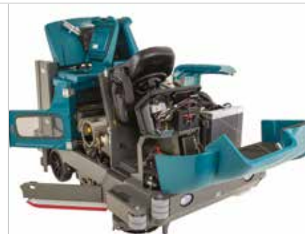
Das Design für einen einfachen Zugriff