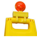
Blinklicht Art. 1.212.004