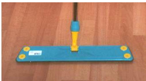
Trapezfeuchtwischgerät mit Gummilammellen 57 cm Art. 6770/55 L