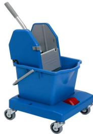
Fahreimer mit Presse Eimer herausnehmbar Art. 2.100.101