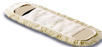
Flachmop mit Taschen 45 oder 50 cm Art. 6609/45 oder 6610/50