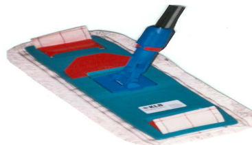
Flachmophalter 45 cm Art. 6602/45