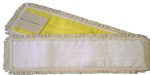
Microfasermop mit Laschen Art. 6614/45