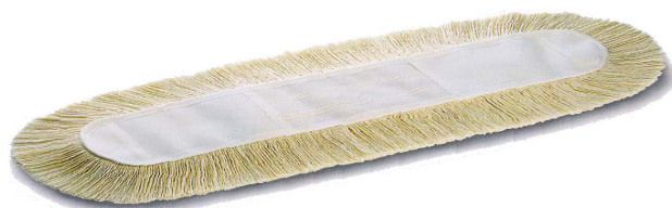
Feuchtwischfranse Baumwolle Art. 6734/40 Art. 6734/60 Art. 6734/80 Art. 6734/110