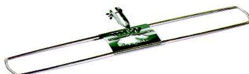
Feuchtwischgestell Metall ohne Stiel Art. 6771/40 Art. 6771/80 Art. 6771/110