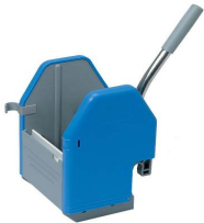
Kunststoffpresse mit Einlage blau/grau Art. 1.210.004