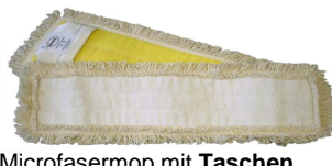
Microfasermop mit Taschen Art. 6613/45