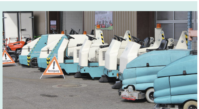
Viel Aufmerksamkeit erregten generell die Tennant-Maschinen. Der Hersteller erweiterte das Angebot mit Strassenreinigungsmaschinen durch Zukäufe von zwei Firmen – Hofmanns und Green-Machines.