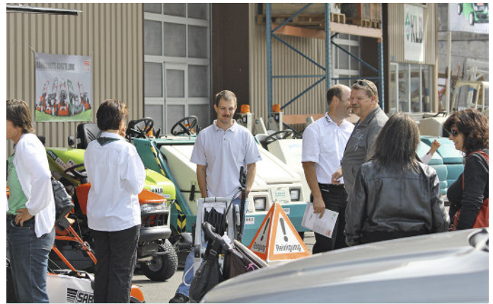
An der KLB-Hausmesse konnten die Besucher die Maschinen nicht nur anschauen, sondern gleich im praktischen Einsatz testen und sich von der Robustheit und der hohen Leistungsfähigkeit überzeugen.

Verpflegt wurden die zahlreichen Gäste von einem KLB-Kunden,